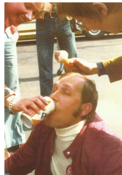
Rom kurz vorm Verdursten, aber die Hilfe kommt spontan und vielseitig