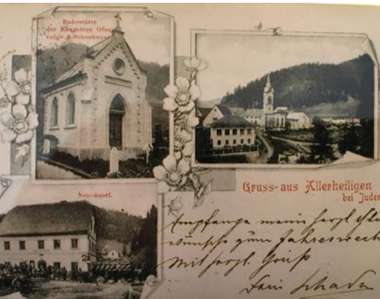
„Gottesdienstordnung um 1900

Durch diesen Priestermangel können nicht mehr alle Pfarren von einem Priester allein betreut werden, Pfarrverbände und Seelsorgeräume sollen helfen, trotzdem die Seelsorge in den einzelnen Pfarren zu ermöglichen. Natürlich sind damit bestimmte Einschränkungen verbunden und wenn wir die Gottesdienstordnung in Allerheiligen von 1900 mit der von heute vergleichen, wird uns erst bewusst wie sehr sich die Zeiten verändert haben.