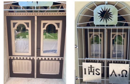
links: Kapelle Passhammer Türen rechts: Kapelle neues Portal