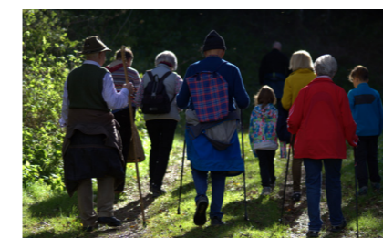
Abschied von der Pfarre

für den PGR zu finden, die bereit sind, Verantwortung für die Gemeinschaft zu übernehmen. Doch was wird uns erwarten, wenn niemand mehr zu dieser Verantwortung bereit ist?